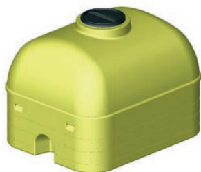
La imagen corresponde al modelo H-3000